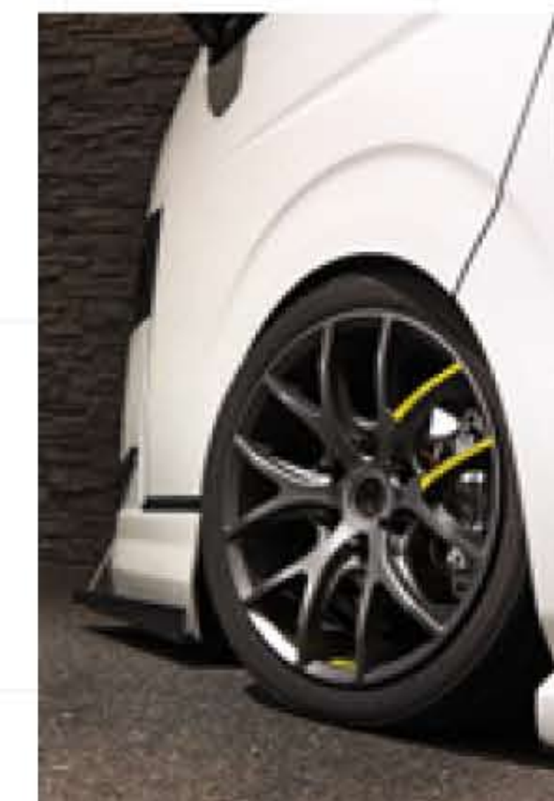
SSL6 LMS edition エスエスエルシックス エルエムエス エディション

6交点の細く伸びやかなY字スポークをディープコンケイブと組み合わせた立体的なデザインが最大の特徴。さらに通常だとタイヤに隠れるリムフランジを長めに設定し、リムの外周ラインを強調。スポークのカラーステッカーがスポーティな雰囲気演出する。