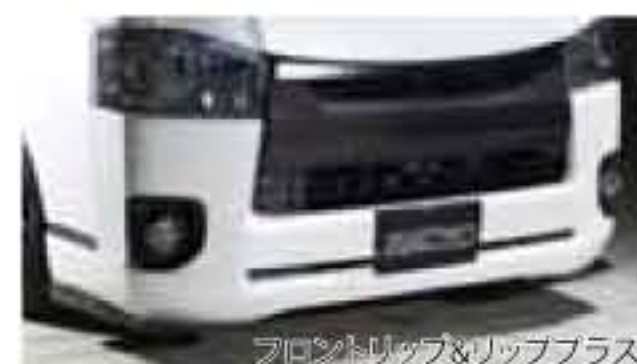
フロントリップ&リッププラス

丁度いい大きさとバランスでロングセラー中のスタイルS。エアロ専用のカナードアイテム、リッププラスをコーナーに追加できる。