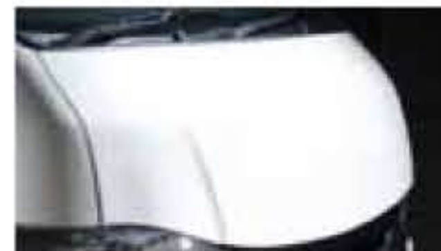
パッドスタイルフード

丁度いい大きさとバランスでロングセラー中のスタイルS。エアロ専用のカナードアイテム、リッププラスをコーナーに追加できる。