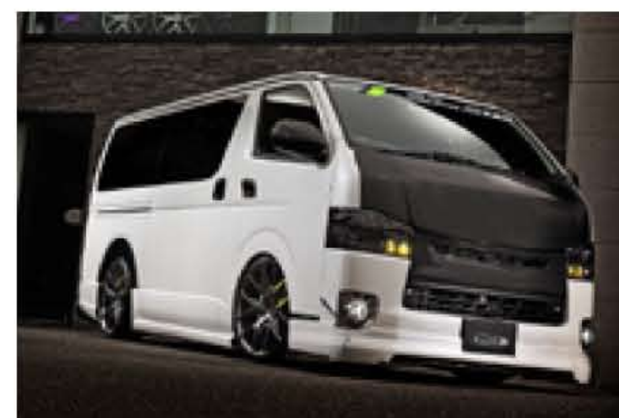
M-Techno / M.T.S.BERTEX LMS edition

問:エムテクノ ☎0120-01-7700 http://www.mts-hiace.co.jp