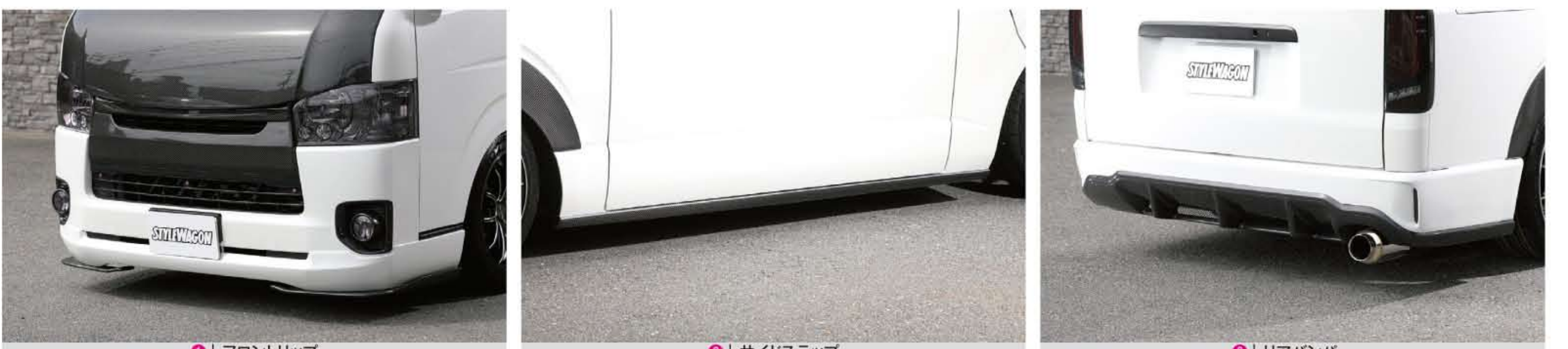
① フロントリップ ② サイドステップ ③ リアバンパー 普段使いにジャストなボリューム感のスタイルSのリップ。さらにリップの両端には、FRP、カーボンの2素材から選べるシンプルデザインのサイドステップ。素材のカラーリング次第でいかようにもコーディネートできるのはメリット。サイドへと流すディフューザー部のみカーボンなど、プレスラインで塗り分けアレンジが自在なリアバンパー。今回はサイドに合わせた塗り分けに。