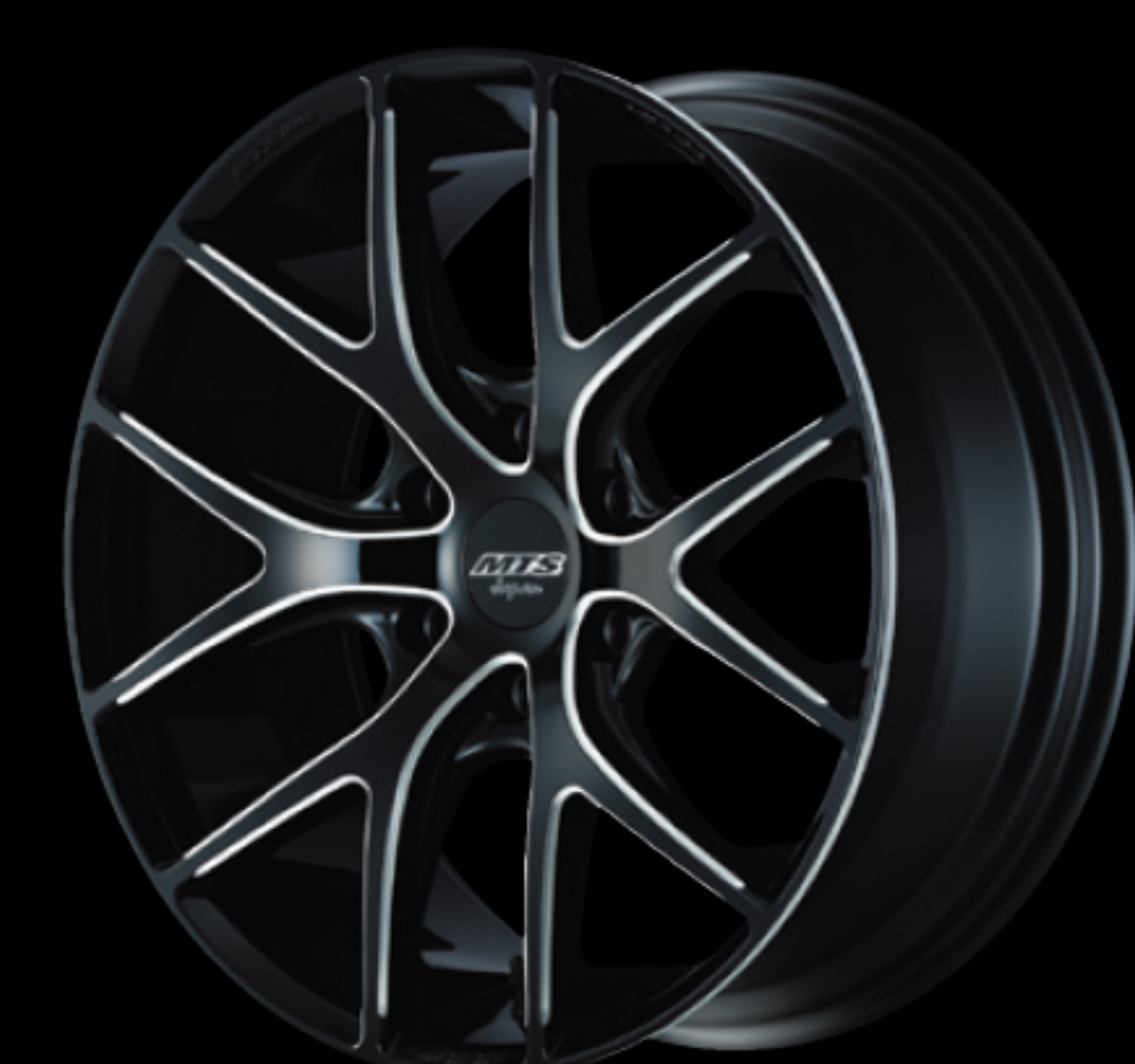
スポークマシニング