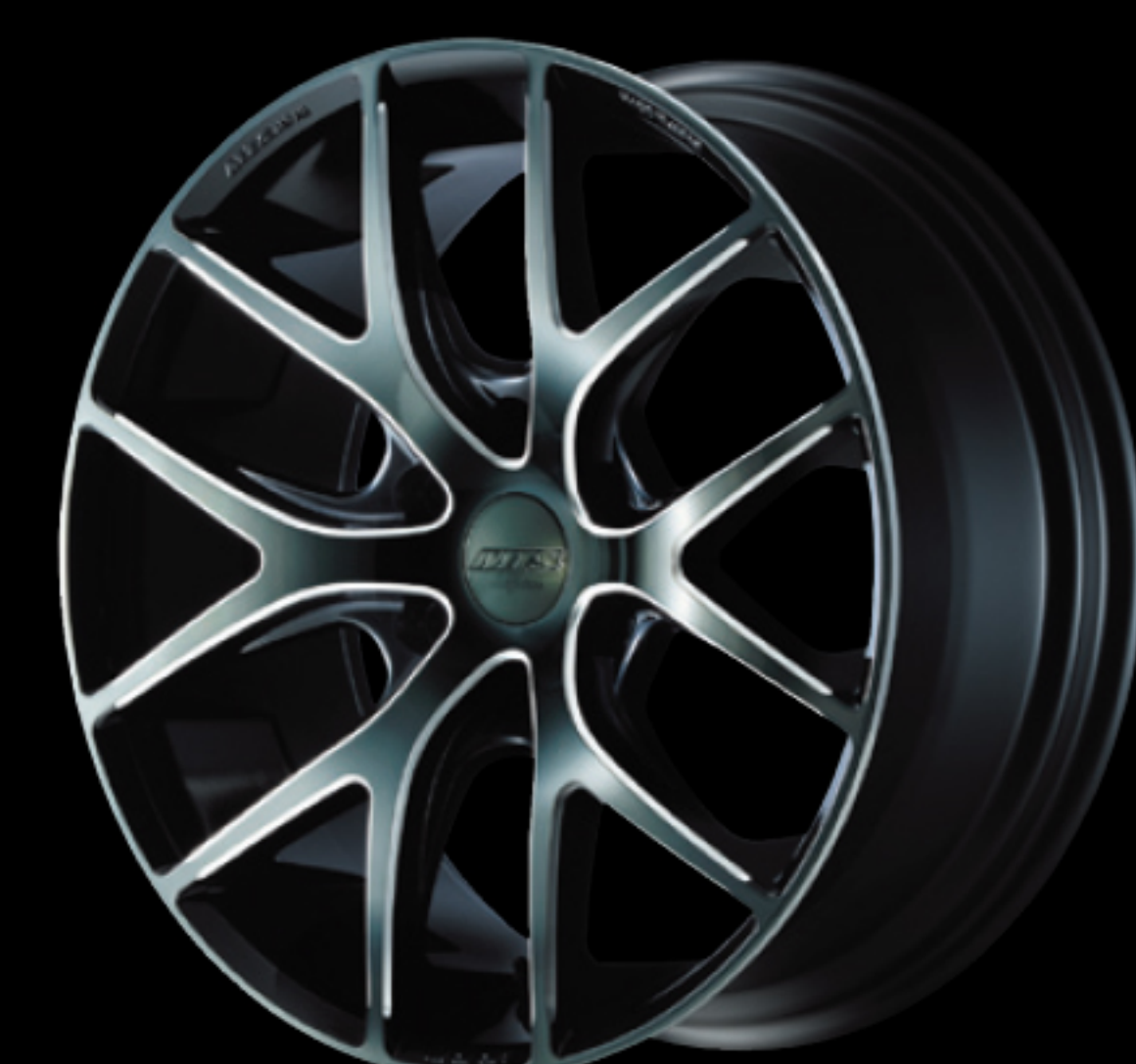
チタンマシニング