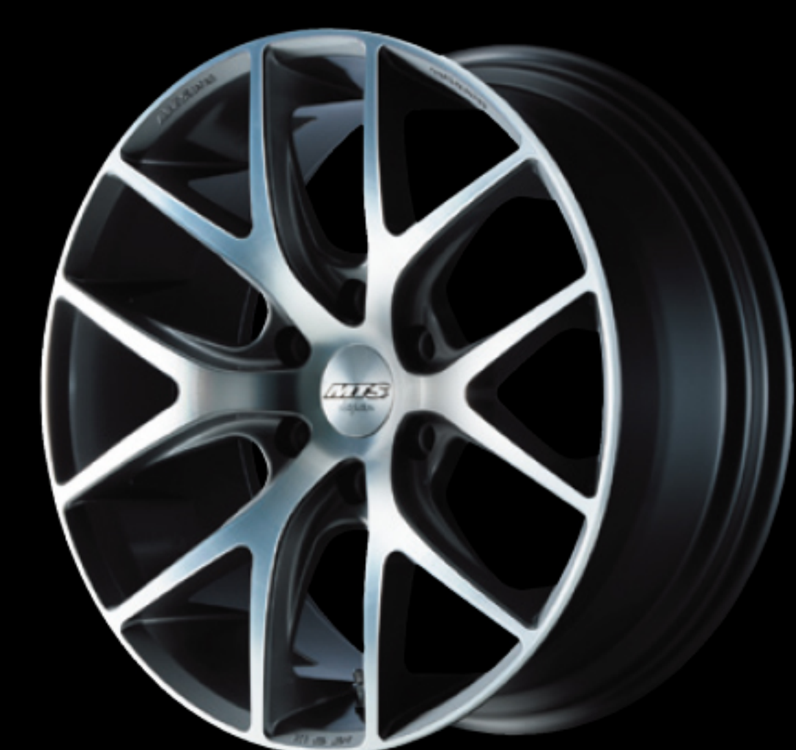
カットテクスチャー