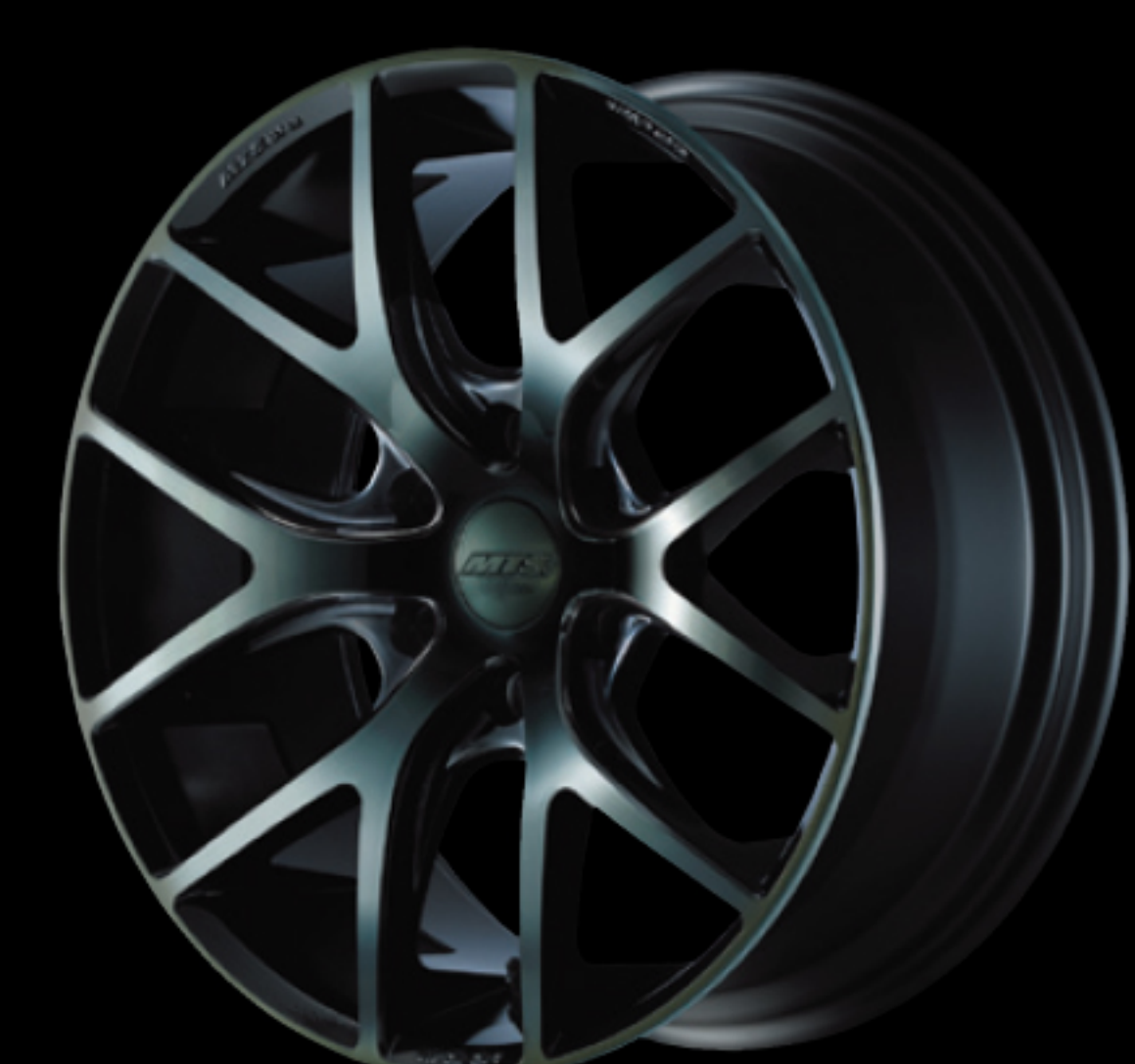
ソニックチタニウム