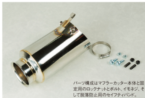
パーツ構成はマフラーカッター本体と固定用のロックナットとボルト、イモネジ、そして脱落防止用のセーフティバンド。

ハイエースのトップメーカーとして多種多彩なパーツを展開しているエムテクノ。なかでもエックスマジックシリーズのマフラーカッターは大人気を得ている。スマッシュヒットアイテム。そんなハイエース界のヒットモデルが30/50プリウス用にリファインされデビューした。 形状はハイエース用と同じく、真円型のステンレスサイレンサーに砲弾アールを組み合わせたスポーティな仕立て。何より嬉しいのは、標準グレードに加え、ツアリングセレクションとモデルリスタ、全3種類のバンパーにジャストフィットすること。リアバンパー下から飛び出す砲弾テールは、スポーティかつアグレッシブなスタイルの演出に最適だ。